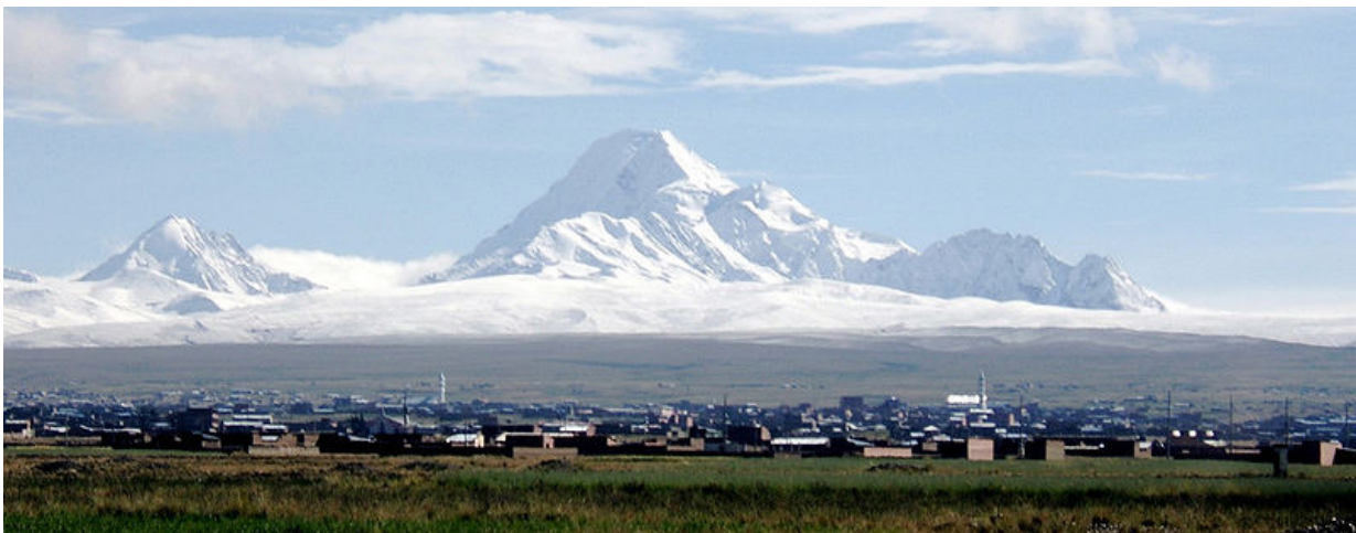
Altiplano mit Huayna Potosi 6088m

Die Cordillera Real erstreckt sich auf einer Länge von 150 Km und ist für Bergsteiger und Wanderer ein Paradies. Zur Akklimatisation werden wir am wunderschönen Titicacasee wandern und die eindruckliche Landschaft geniessen. Die ersten Bergtouren werden im Condoririgebiet unternommen. Eine zweitägige Trekkingtour über zwei Pässe führt uns zum Hochlager des Huayna Potosi, unserem ersten 6000er in Bolivien. Die Krönung unserer Reise werden die Besteigungen vom Illimani 6640m und des Höchsten Berges Boliviens dem Sajama 6542m sein.